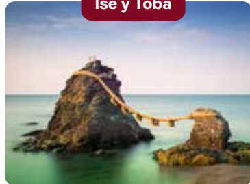
Ise y Toba

Situados en el P. N. de Ise-Shima, conocido por el santuario sintoísta de Ise; y por sus "granjas de perlas", entre las que destaca la situada en la Isla de las Perlas de Mikimoto en Toba, lugar en el que también se encuentran las "Rocas Casadas (Meotoiwa)" que señalan el lugar sagrado al que descienden los dioses y símbolo del buen matrimonio. Bellos paisajes naturales, una costa salpicada por islas y rías que se adentran en la tierra, convierten este lugar en uno de los principales destinos de descanso, espiritualidad y ocio.